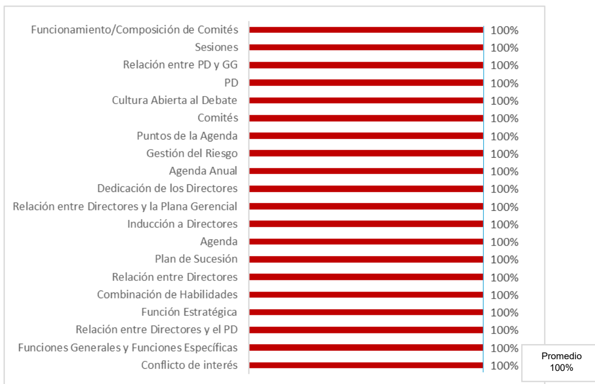
Grafico N°1: Autoevaluación del directorio – Resultados por elemento